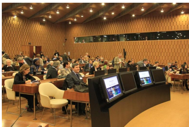
Arriba a la izquierda: Mesa inaugural de MPE2013