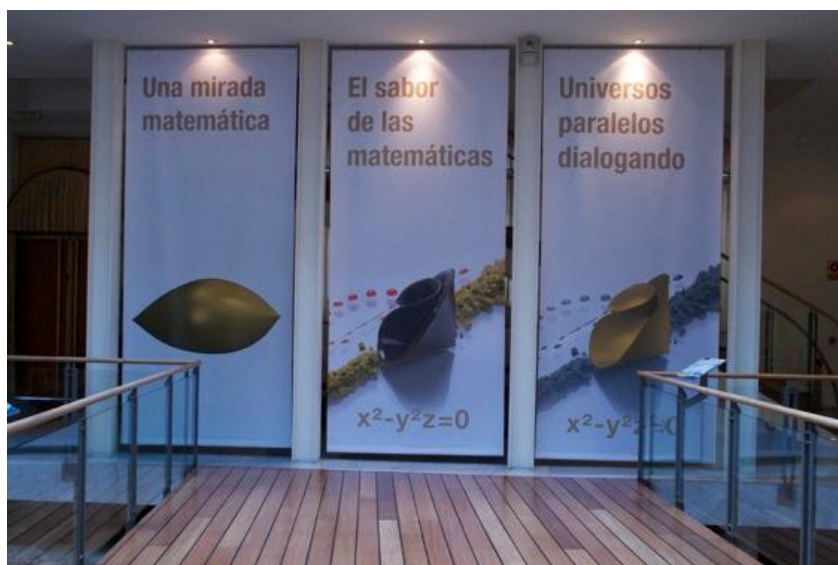
Carteles anunciadores de las tres colecciones

La Real Sociedad Matemática Española, la Universidad de Málaga y Cajamar se mostraron muy satisfechas por la colaboración en esta muestra cultural que integra Matemáticas y Gastronomía y que tiene como uno de sus objetivos transmitir al público la sensibilidad artística y emocional que se puede expresar y provocar a través de las Matemáticas.