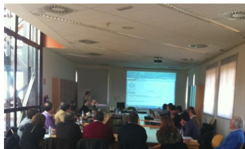
Reunión de Decanos y Directores de Matemáticas