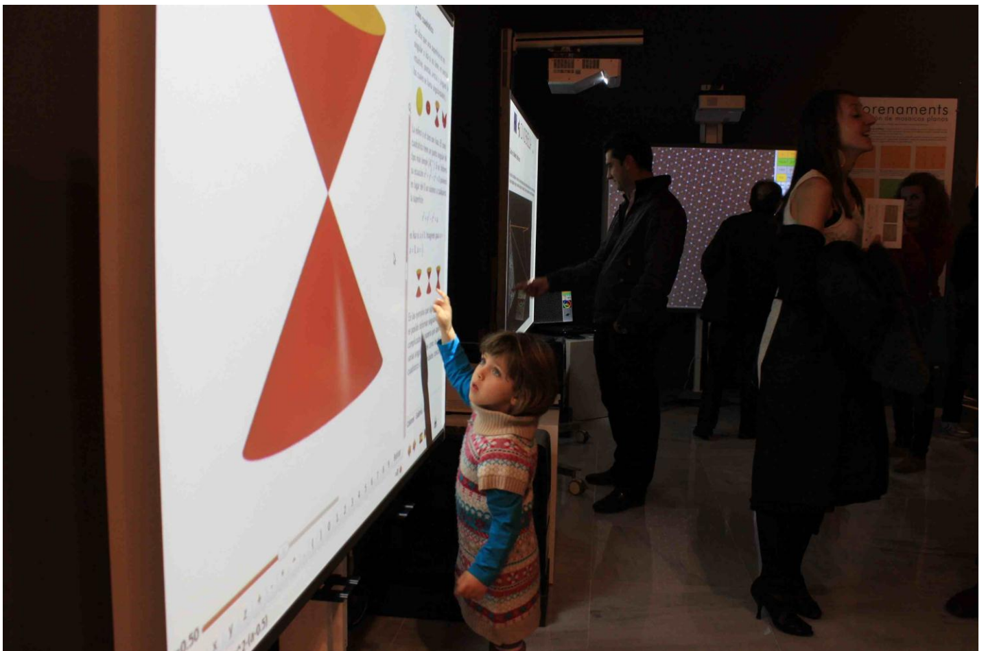
La sorpresa ante el descubrimiento