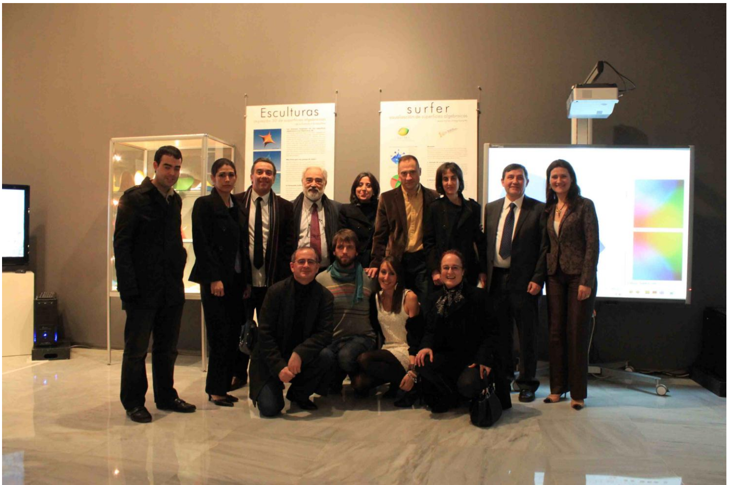
El equipo de RSME-Imaginary-Málaga