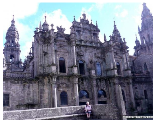
Santiago de Compostela