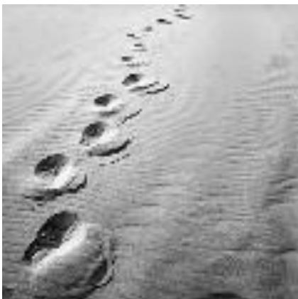
Imagen de Matematicalia en su editorial