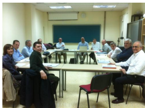
Reunión de directores de institutos universitarios de Matemáticas