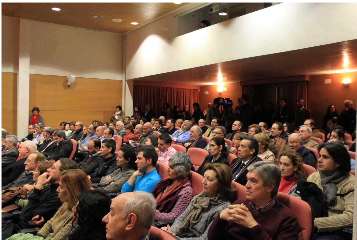
Público en la inauguración en el Rectorado el día 9 de febrero